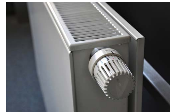
Geringverdiener erhalten Unterstützung bei ihren Heizkosten.

Die Reservierung und Abholung der Monatskarte für Alberndorf ist während der Öffnungszeiten des Gemeindeamtes möglich.