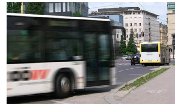
Günstig mit den Öffis unterwegs.

Nähere Informationen finden Sie unter www.land-oberoesterreich.gv.at .