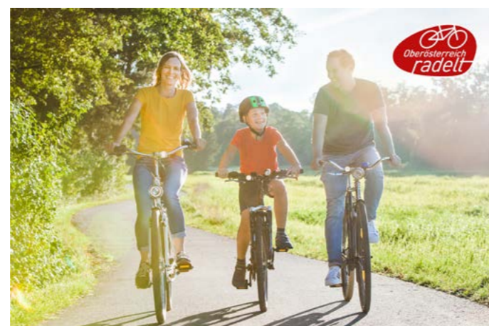
Radl'n, eintragen und mit etwas Glück gewinnen!

Zusätzlich wurde auch die Sanitäreanlage winterfit gemacht und kann ab sofort ganzjährig genutzt werden.